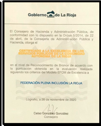
2017-Declaración Utilidad Pública 2020- Meninas compromiso ético 2020. EFQM Bronce