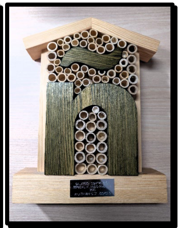
2022-Mérito Civil 2023- Reconocimiento compromiso 2023-Sensibilización ambiental