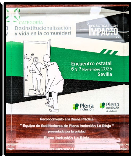
2024-Mérito Social Penitenciario 2025-Acreditación Calidad Plena 2025-BBPP Servicio Facilitador